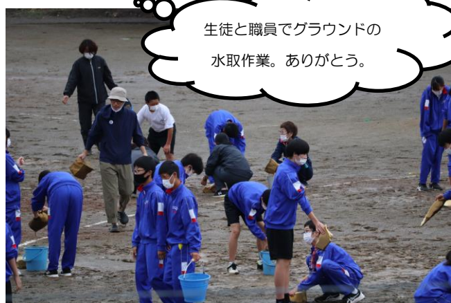
生徒と職員でグラウンドの水取作業。ありがとう。