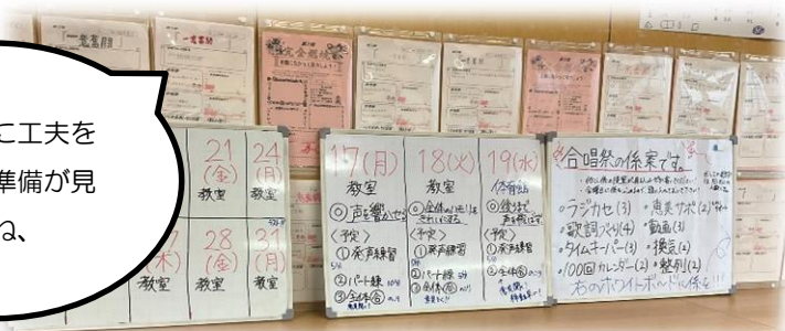
学級ごとに工夫を凝らした準備が見られますね、

11月1日の合唱祭に向けて、合唱練習がスタートしました。体育祭が終了してから、各学級では歌詞カードや練習計画などを作成し、準備をしてきました。先日のご案内の通り、今年度は学年ごとの入れ替え方式で保護者のみなさまから参観いただく予定でおります。各学級の歌声が、どんどん洗練されていくのが楽しみです。どうぞご期待ください。