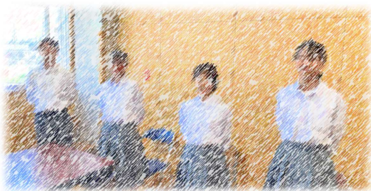
各学年代表の生徒と生徒会代表生徒

さらに、様々な活動の中で、葛藤やトラブル、課題に向き合って、仲間と共に解決する経験が、一人一人の心を大きく成長させます。城北を誇りに思い社会に貢献できる若者になれるよう、皆様からの応援もよろしくお願いいたします。