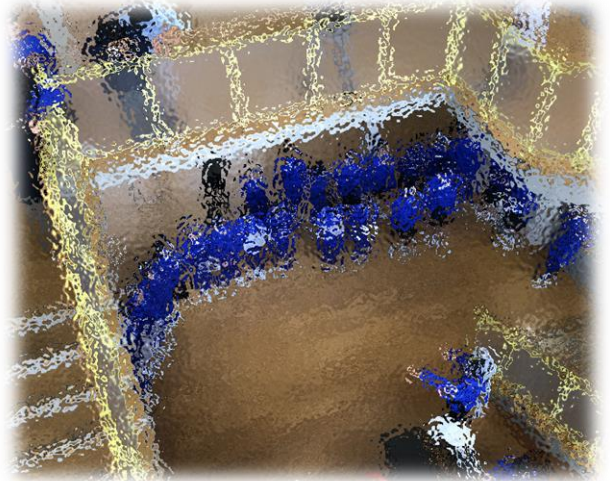
放課後合唱練習初日の様子です。2年生の歌声に感動した1年生が見学に来ていました。

上記は令和2年度合唱祭のスローガンです。合唱祭がいよいよ来週末に迫ってきました。音楽の授業をはじめ、昼休みや放課後の時間を利用して練習に励んでいます。今年度は、合唱祭実行委員会を組織し、できるだけ生徒の力で企画や運営を行うことにしました。指揮者、伴奏者、パートリーダーはもちろんのこと、合唱の得意・不得意関係なく、自分のため、学級のためを思いとてがんばっている様子が見えます。